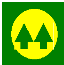
El Escudo del Cooperativismo